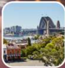
SYDNEY OBSERVATORY HILL