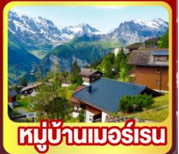
หมู่บ้านเมอร์ส