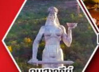
อนุสาวรีย์