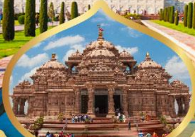
วิหารอักซาร์ดีม