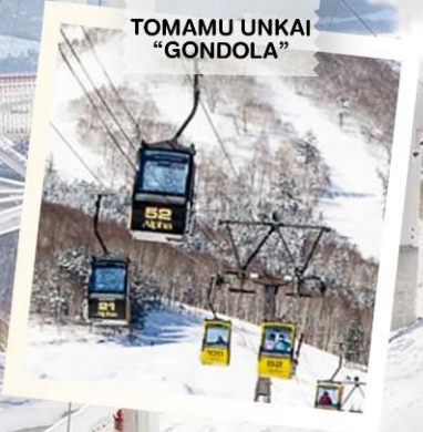
TOMAMU UNKAI “GONDOLA”