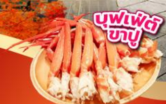
บุฟเฟ่ต์ ชาบู

เช็किनจุดถ่ายรูป ศาลเจ้าฟูจิซัง ฮ่องกงเซ็นทรัล