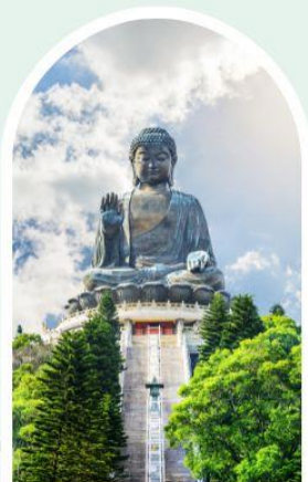
พระใหญ่โป่หลิน