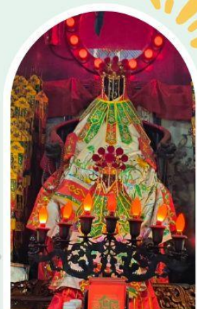
วัดเจ้าแม่กวนอิมองอ่า