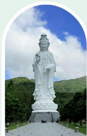
วัดเจ้าแม่กวนอิมซัน

"ไหว้พระ เสริมดวง เพิ่มสิริมงคลแก่ชีวิต"