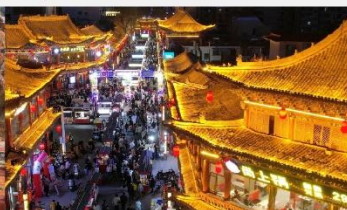
ตลาดกลางคืนจางเย่

*ทางบริษัทฯ ขอสงวนสิทธิ์ในการสลับโปรแกรมทัวร์ตามความเหมาะสมขึ้นอยู่กับสถานการณ์หน้างาน โดยคำนึงถึงผลประโยชน์ของลูกค้าเป็นสำคัญ