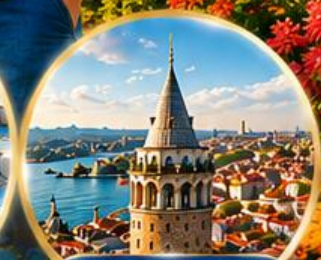
หอคอยกาลาตา Galata Tower