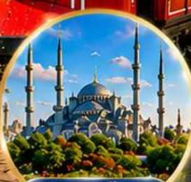
สุเหร่าสีน้ำเงิน Blue Mosque