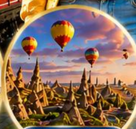
เมืองคัปปาโดเกีย Cappadocia