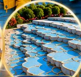
ปานุกคาล์ Pamukkale