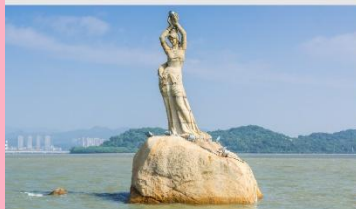
จู่ไห่ฟิชเชอร์เกิร์ล(หวีหนี่)