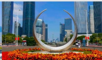
จัตุรัสฮั่วเจิง

*ทางบริษัทฯ ขอสงวนสิทธิ์ในการสลับโปรแกรมทัวร์ตามความเหมาะสมขึ้นอยู่กับสถานการณ์ปัจจุบัน โดยคำนึงถึงผลประโยชน์ของลูกค้าเป็นสำคัญ