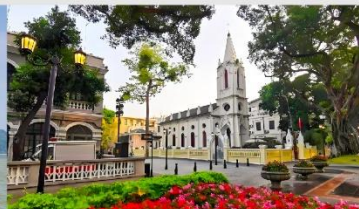
เกาะชาเมี่ยน