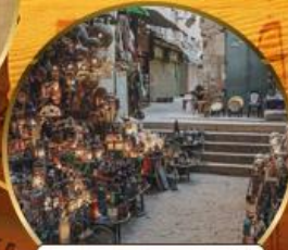
ตลาดบ้านเอลคาลิลี