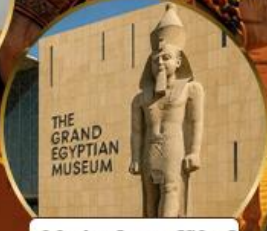
พีพีรภัณฑ์แกรนด์อียิปต์