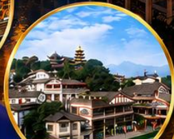
เมืองโบราณเฉิงชิว