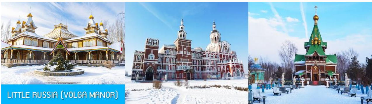
LITTLE RUSSIA (VOLGA MANOR)

รับประทานอาหารเช้า ณ ห้องอาหารของโรงแรม (11)