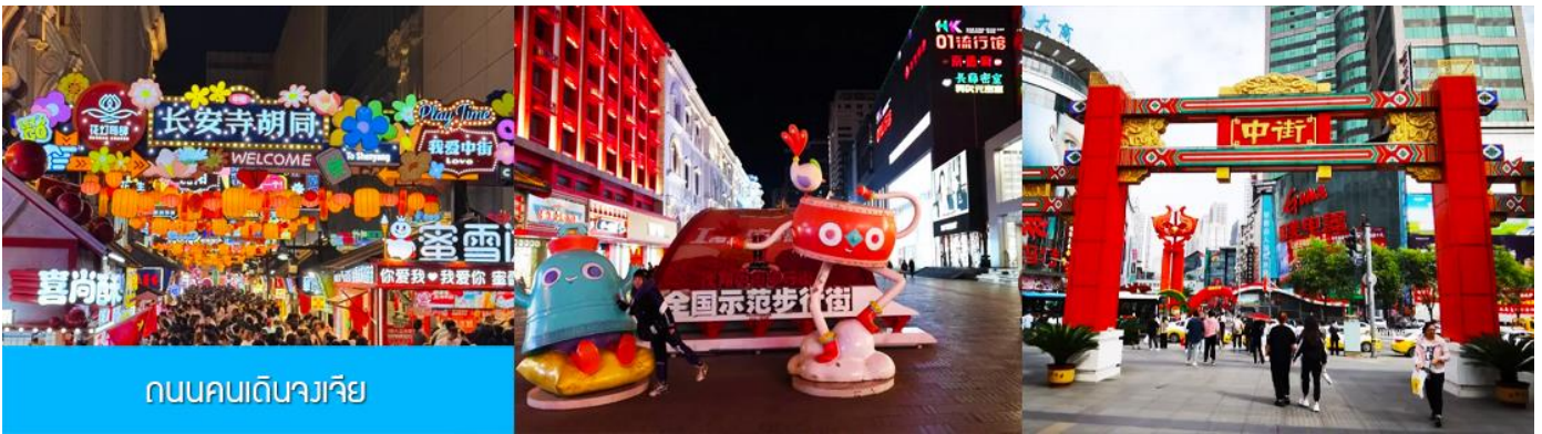
ถนนคนเดินจางเจีย