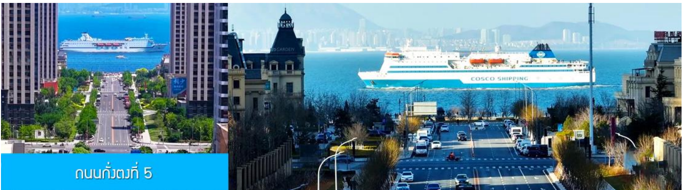
ถนนกั๋วตง 5