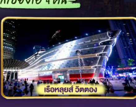
เรือหลุยส์ วัดตอง