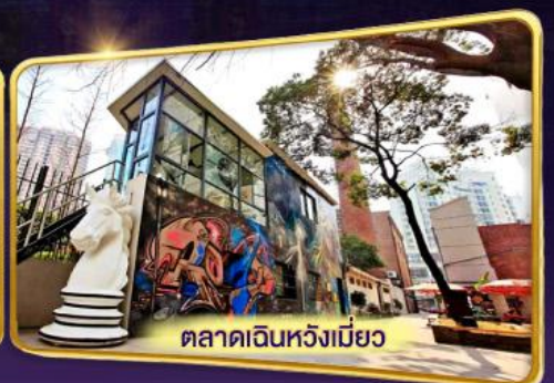
ตลาดเดินหวังเมี่ยว