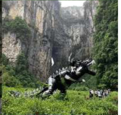
THREE NATURAL BRIDGE