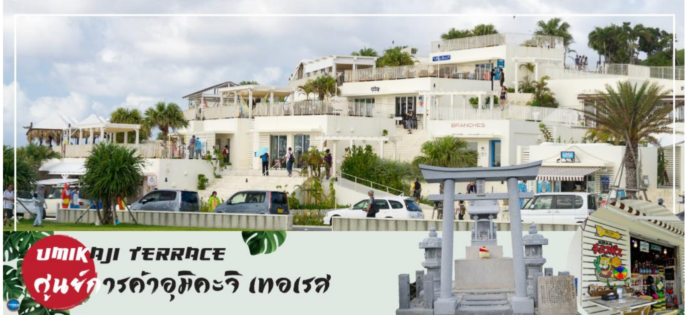
UMIKAJI TERRACE ศูนย์การค้าอุมิคะจิ เทอเรส

ใช้เวลาอันสมควรนำท่านเดินทางสู่โรงแรมที่พัก (ใช้เวลาเดินทางประมาณ 30 นาที) ที่พัก HOTEL ART STAY NAHA KOKUSAI-DORI หรือเทียบเท่า