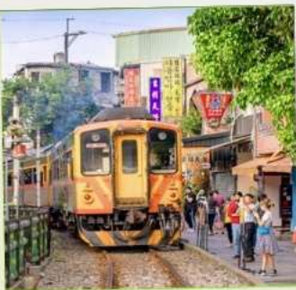
สถานีรถไฟซือเฟิ่น