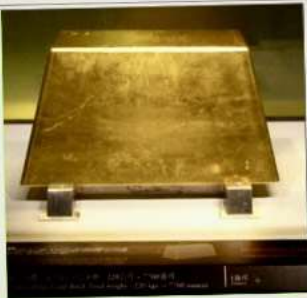
พิพิธภัณฑ์ทองคำ