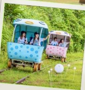
Shen'ao Rail Bike