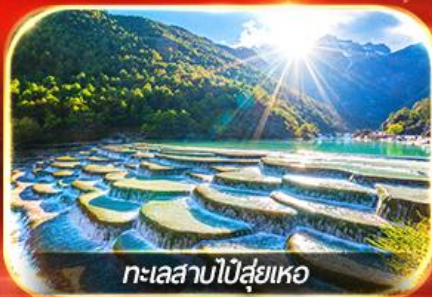
ทะเลสาบไม้ส่ายเหอ