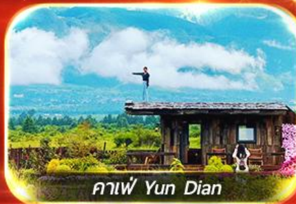
กาแฟ Yun Dian