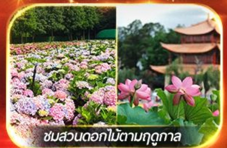
ชมสวนดอกไม้ตามฤดูกาล

นั่งกระเช้าสู่กุเขาสหะมังกรหยก ชมโชว์ทิเบต "Impression Lijiang" สุดอลัง เชคอินคาเฟ่วิวกุเขาสหะ, ชมดอกไม้ตามฤดูกาล