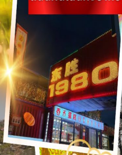
ถนนคนเดินคังบาหิซี