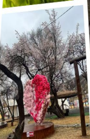
สวนแอปริคอต