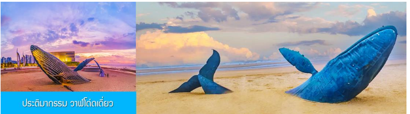
ประติมากรรม วาฬโดดเดี่ยว

จากนั้นนำท่านเดินทางสู่ เมืองเยียนไถ 烟台 (ระยะทาง 85 กม. ใช้เวลาเดินทางราว 1 ชั่วโมงเศษ)