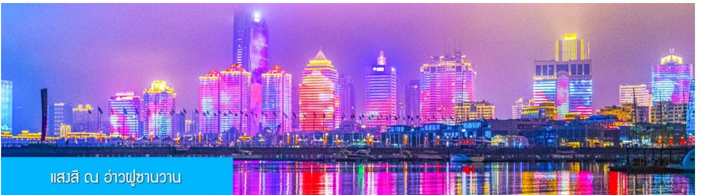
แอสสิ ณ อ่าวฟู่ซานวาว

ค่ำ รับประทานอาหารค่ำ ณ ภัตตาคาร *เมนูซีฟู้ด (3)