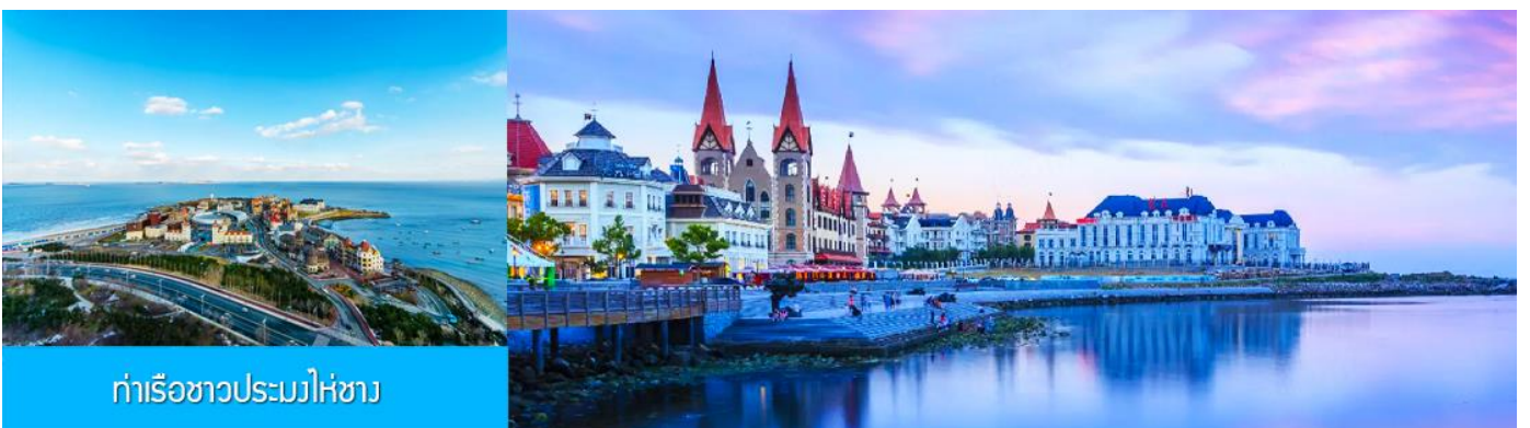
ท่าเรือชาวประมงไห่ซาง