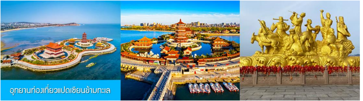
อุทยานท่องเที่ยวแปดเซียนข้ามทะเล