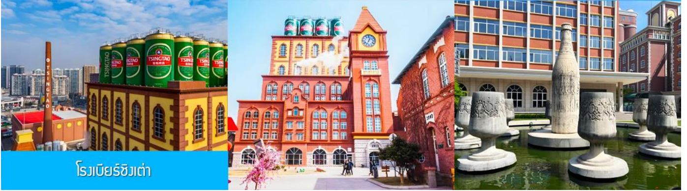
โรงเบียร์ชิงเต่า

จากนั้นนำท่านเที่ยวชม โรงเบียร์ชิงเต่า 青岛啤酒博物馆 พิพิธภัณฑ์เบียร์ที่ขึ้นชื่อของเมืองชิงเต่า ซึ่งเป็นเบียร์ยี่ห้อแรกที่ผลิตขึ้นในประเทศจีน ชมเบียร์ คอลเลกชั่นที่มียี่ห้อหลากหลายที่สุดของโลก และชมการจัดแสดงภาพและวิทัศน์เกี่ยวกับวิวัฒนาการของเบียร์ ขั้นตอนการผลิตและอื่น ๆ ที่เกี่ยวข้อง พร้อมชิมเบียร์ชิงเต่า ซึ่งเป็นเบียร์ที่ขายดีที่สุดในยี่ห้อหนึ่งของจีน.. (ชิมเบียร์ชิงเต่าท่านละ 1 แก้ว รับกลับอีก 1 ขวดเล็ก ตอนเดินออก)