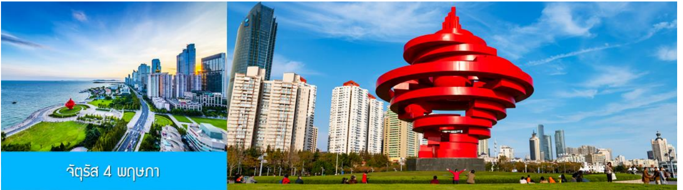
จัตุรัส 4 พฤษภาคม

จากนั้นนำท่านเที่ยวชม โรงเบียร์ชิงเต่า 青岛啤酒博物馆 พิพิธภัณฑ์เบียร์ที่ขึ้นชื่อของเมืองชิงเต่า ซึ่งเป็นเบียร์ยี่ห้อแรกที่ผลิตขึ้นในประเทศจีน ชมเบียร์ คอลเลกชั่นที่มียี่ห้อหลากหลายที่สุดของโลก และชมการจัดแสดงภาพและวิทัศน์เกี่ยวกับวิวัฒนาการของเบียร์ ขั้นตอนการผลิตและอื่น ๆ ที่เกี่ยวข้อง พร้อมชิมเบียร์ชิงเต่า ซึ่งเป็นเบียร์ที่ขายดีที่สุดในยี่ห้อหนึ่งของจีน.. (ชิมเบียร์ชิงเต่าท่านละ 1 แก้ว รับกลับอีก 1 ขวดเล็ก ตอนเดินออก)