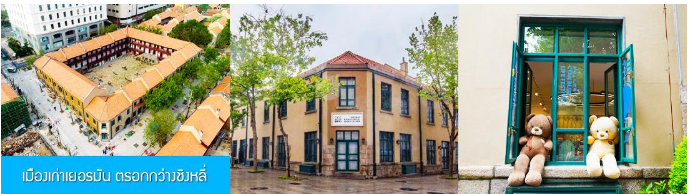
เมืองเก่าเยอรมัน ตรอกกว้างชิงหลี่

จากนั้นนำท่านเดินเที่ยวชม ถนนจงซาน 中山路 ถนนที่เต็มไปด้วยกลิ่นอายยุโรป และถนนสายนี้มีบันทึกเรื่องราวมากกว่าศตวรรษของเมืองชิงเต่าไว้ ที่นี่เป็นศูนย์กลางการค้าแห่งแรกที่เต็มไปด้วยสถาปัตยกรรมสไตล์ยุโรปเก่าแก่ที่ได้รับอิทธิพลมาจากเยอรมัน ให้ท่านได้เดินเก็บบรรยากาศ และ เก็บภาพกับโบสถ์เซนต์ไมเคิล (ด้านนอก) โบสถ์แห่งนี้ที่คู่รักนิยมมาถ่ายภาพงานแต่งงานด้วยกันมากที่สุดในเมืองชิงเต่า ให้ท่านถ่ายรูปเก็บภาพ