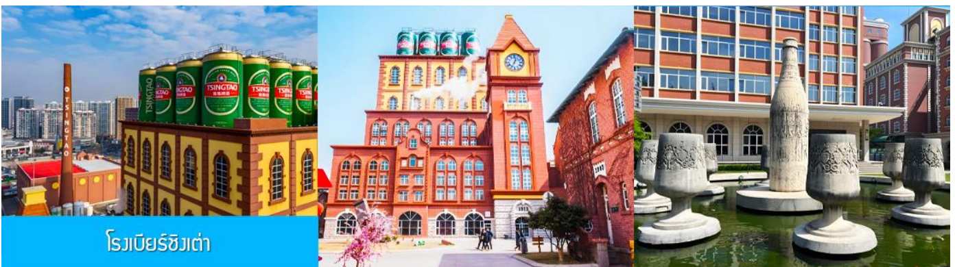
โรงเบียร์ชิงเต่า

รับประทานอาหารกลางวัน ณ ภัตตาคาร *เมนูซีฟู้ด (2)