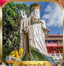
เจ้าแม่กวนอิม พลัสเบย์