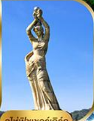
จูไห่ฟิชชอร์ทิวรา