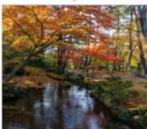
สวนเคนโระคุเซ็น