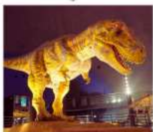
พิพิธภัณฑ์ไดโนเสาร์