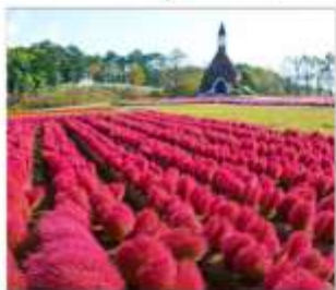
สวนดอกไม้มัมกคะโนะซาโตะ