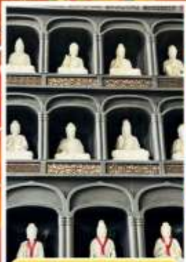
วัดไดชิซังเซโด้จิ