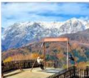
ฮาคูนะอิวาทาเกะ