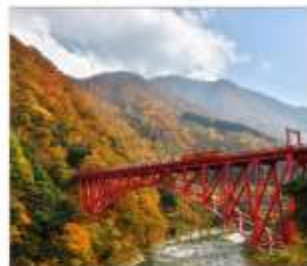
รถไฟชมวิวกุซุมเงาคุโรมะ