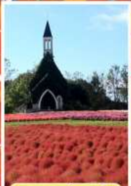
สวนบกกะโนะซาโตะ