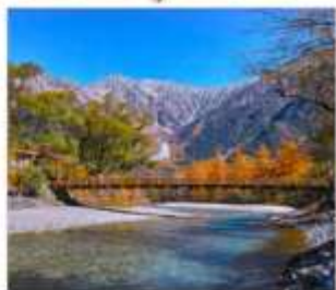
ดามิโดจิ