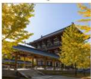
วัดไดชิซังเซอิโดจิ