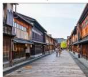
ย่านโรงน้ำชาอิงาชิบายะ