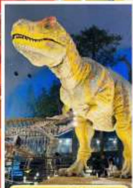
พิพิธภัณฑ์ไดโนเสาร์