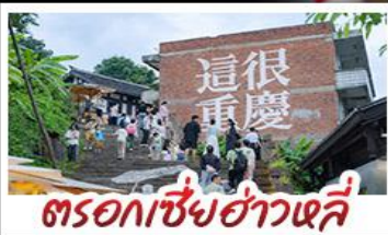
ตรอกเซี่ยฮ่าวหลี่