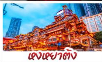
เจงเฉาตัง