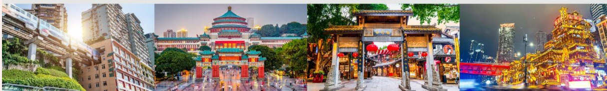
รถไฟฟ้าทะเลตึก