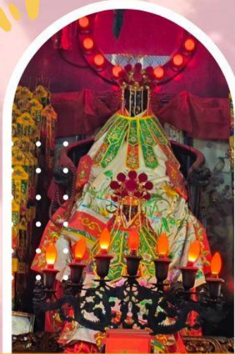
วัดเจ้าแม่กวนอิมฮ่องกง ขอพรเรื่องเงิน ทรัพย์สิน และความมั่งคั่ง