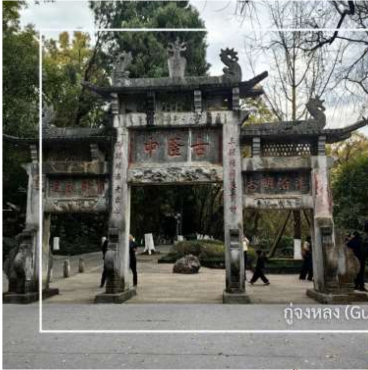
กุหลองจง (Gulongzhong)

หลังอาหารเช้านำท่านสู่ กุหลองจง (Gulongzhong) แหล่งท่องเที่ยวทางประวัติศาสตร์และวัฒนธรรมที่มีชื่อเสียง ตั้งอยู่ใกล้เมืองเซียงหยาง เป็นสถานที่พำนักของ จูกัดเหลียง (ขงเบ้ง) นักปราชญ์และนักยุทธศาสตร์ผู้ยิ่งใหญ่แห่งยุคสามก๊ก สถานที่แห่งนี้ในอดีตคือสถานที่ที่เล่าปี่ได้เดินทางมาพบกับจูกัดเหลียงที่เชิญตัวไปร่วมทัพ ปัจจุบันสถานที่นี้โอบล้อมด้วยธรรมชาติ สะท้อนบรรยากาศแห่งการศึกษา และวางแผนการเมืองในอดีต พร้อมให้ท่านได้เรียนรู้เรื่องราวทางประวัติศาสตร์อันทรงคุณค่า พร้อมสัมผัสบรรยากาศที่เชื่อมโยงกับตำนานและภูมิปัญญาจีนโบราณ จึงนับเป็นจุดหมายสำคัญสำหรับผู้ที่สนใจประวัติศาสตร์ยุคสามก๊ก และวัฒนธรรมจีน