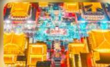
ถนนวัฒนธรรมต้าถิง