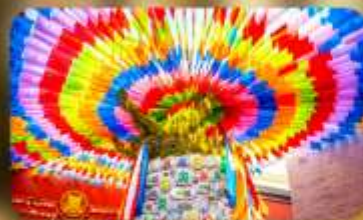
วัดลามะกว้างเหริน