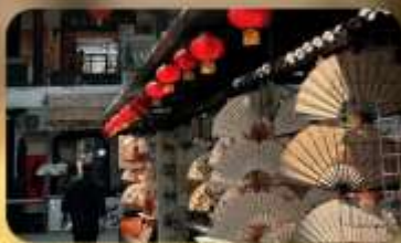
ถนนโบราณซูหยวนเหมิน