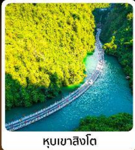
คุบเขาสิงโต

โอไคท์! บินตรงลงเอ็นซีอ เที่ยวเอ็นซีอเน้นๆจัดทีมทัวเมือง คุบเขาสิงโต ผิงชานแกรนด์แคนยอน อุกยานจีนลู่ชาน