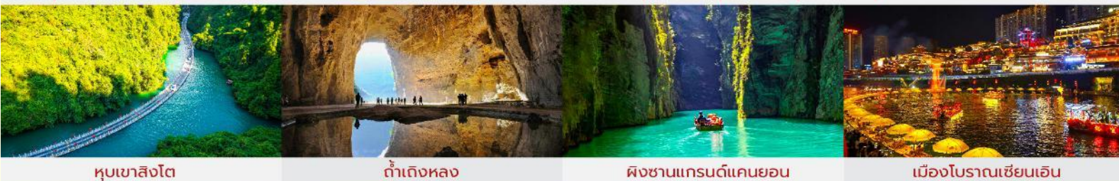
หุบเขาสิงโต