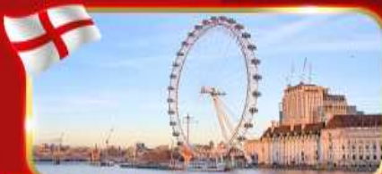
ชมวิวชิงช้าที่สูงที่สุดในยุโรป ลอนดอนอาย