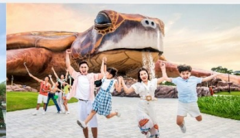
วินเพิร์ล อควาเรียม

*ทางบริษัทฯ ขอสงวนสิทธิ์ในการสลับโปรแกรมทัวร์ตามความเหมาะสมขึ้นอยู่กับสถานการณ์หน้างาน โดยคำนึงถึงผลประโยชน์ของลูกค้าเป็นสำคัญ