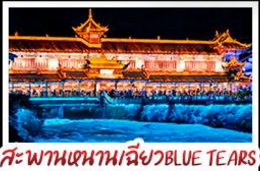
สะพานหนานเฉียวBLUE TEARS

สวนเม่านงวา - อุทยานหลุมฟ้าสะพานสวรรค์ สีดรุณี - หงหยาดัง - รถไฟฟ้าทะเลตึก สะพานหนานเฉียว BLUE TEARS พักโรงแรมระดับ 4 ดาว - ไม่ลงร้านช้อปปิ้ง เมบูพิศษ สุกัหมาล่า เปิดปิกนิก