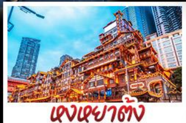
แสงฉายาตัง