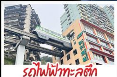
รถไฟฟ้าทะเลตึก