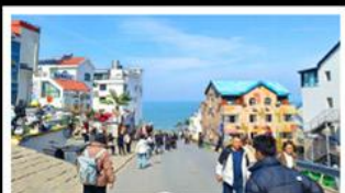
ถนนคอปเปลิ่งหมายเลข 8

สัมผัสความยิ่งใหญ่ของ 4 เมืองสำคัญ ชิงเต่า - เยียนโก - เฟิงไห่ - เว่ย์ไห่ ปาด้ากวน - โบสถ์คาทอลิก - ตึกเก่าริมหา