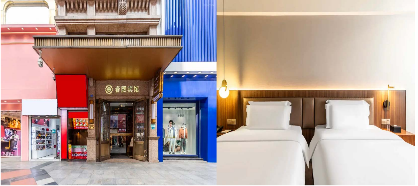
โรงแรมใจกลางย่านช้อปปิ้งชุนซีลู่

Cheangdu Chunxi Hotel ย่านช้อปปิ้งชุนซีลู่ หรือระดับเทียบเท่า พักห้องละ 2-3 ท่าน หมายเหตุ โรงแรมที่พัก จะแจ้งให้ท่านทราบ ก่อนเดินทางโดยประมาณ 5-7 วันทำการ