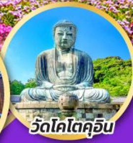
วัดโคโตคุอิน