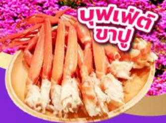
บุฟเฟ่ต์ ซาชิมิ