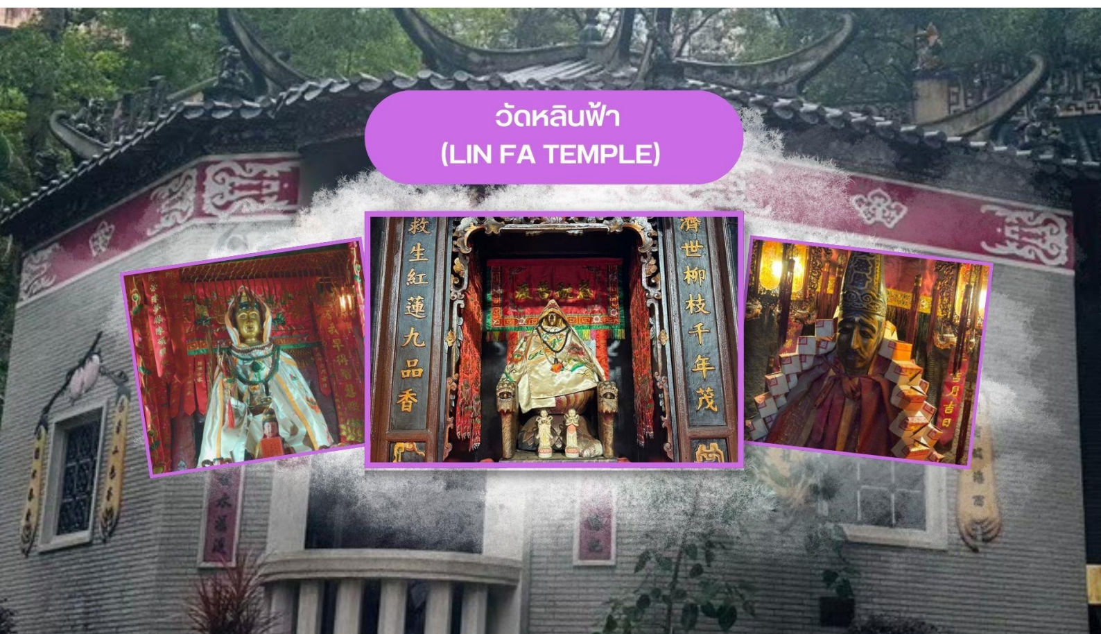
วัดหลินฟ้า (LIN FA TEMPLE)

ฮ่องกง เมืองแห่งสีสันและวัฒนธรรมที่ไม่เคยหลับใหล เป็นเมืองที่เต็มไปด้วยพลังและชีวิตชีวา ตั้งอยู่บนชายฝั่งทางตอนใต้ของจีน ที่นี่เป็นศูนย์กลางทางเศรษฐกิจ การเงิน และการท่องเที่ยวระดับโลก ผสมผสานระหว่างวัฒนธรรมตะวันออกและตะวันตกได้อย่างลงตัว