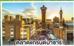
ตลาดแกรนด์บาซาร์