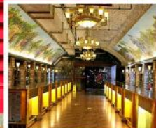
พิพิธภัณฑ์ไวน์ชิงเต่า