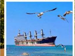
เรือสินค้าเกย์ตันบลูอิส