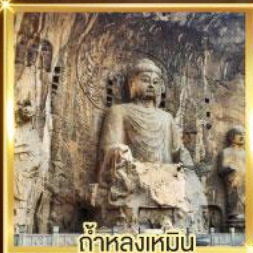
ถ้ำหลงเหมิน