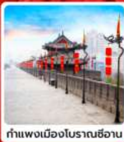
กำแพงเมืองโบราณซีอาน