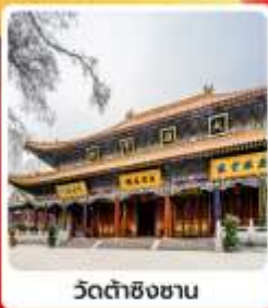
วัดต้าซิงชาน

• ไฮไลท์เที่ยวชมมรดกโลก สุสานกองทัพทหารจีนซีอานองเดี ถ่ายภาพความยิ่งใหญ่ของเจดีย์ห้าชั้นปาใหญ่