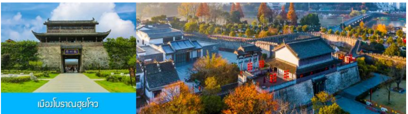
เมืองโบราณซูโจว

จากนั้นนำท่านเดินทางโดยรถบัสสู่ เมืองโบราณซูโจว (ระยะทาง 149 กม. ใช้เวลาเดินทางราว 2 ชั่วโมงเศษ)