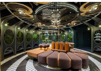
ห้องน้ำไอเทค