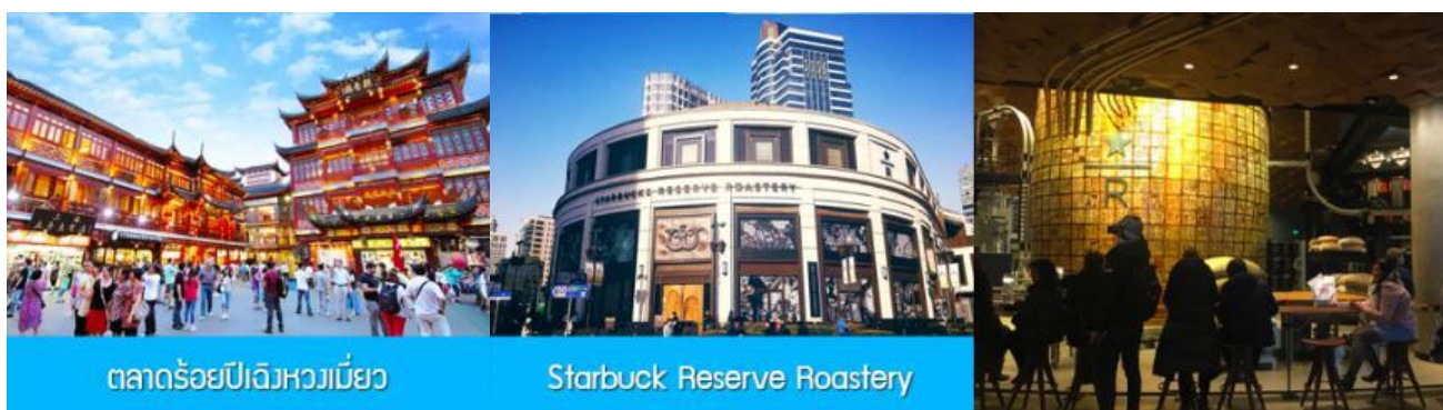
ตลาดร้อยปีฉงหวงเมี่ยว

พักที่ โรงแรม Holiday Inn Express Hotel 4* หรือเทียบเท่าในนครเซี่ยงไฮ้