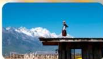
กาแฟ Yun Yi Tang