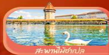
สะพานไม้ซังปก

Highlight เยือนหมู่บ้านแสนสวยเซอร์แมท เช็กอินศาลาไทยสุดงามที่โลซาน เที่ยวลูเซิร์น ชมสะพานไม้ซังและอนุสาวรีย์สิงโต ซาลี แพลสซึน ชมประติมากรรม The Fork และปราสาทซิลลองริมทะเลสาบ เยือนมิลาน มหาวิหารดูโอโม เที่ยวเวนิส เมืองลอยน้ำสุดโรแมนติก อินกับรักอมตะที่บ้านจูเลียต และช้อปปิ้งจุใจที่ Serravalle Outlet