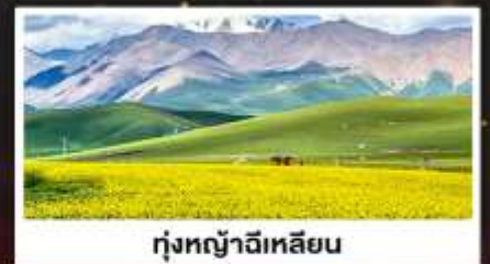
ทุ่งหญ้าฉีเหลียน