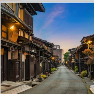
“TAKAYAMA OLD TOWN”