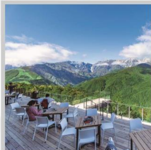
“HAKUBA MOUNTAIN HARBOR”

นำท่านไปโอบกอดธรรมชาติที่ครบครันในที่เดียว “คามิโคจิ” สวิสเซอร์แลนด์แดนญี่ปุ่นเทือกเขาที่ปกคลุมด้วยหิมะสวยงาม ชมความงามของ “ทุ่งพืชมอส ฟุจิชิบะซากุระ” มนต์เสน่ห์..พรมธรรมชาติสีชมพูหลากสีสดใส เปลี่ยนอริยาบท “ขึ้นกระเช้าฮาคุบะ อิวะตะเกะ” เพื่อชมวิวพาโนรามาของเทือกเขาแอลป์ญี่ปุ่นกันให้อิ่มใจ สัมผัสกลิ่นอายเมืองเก่า “เมืองทาคายามา” ที่ยังคงอนุรักษ์ความเป็นอยู่ เมื่อสมัยเอโดะกว่า 300 ปี สายช้อปปิ้งห้ามพลาด “คารุอิซาวะ เอ้าท์เล็ต” แลนด์มาร์กของเมืองคารุอิซาวะ และ “ย่านชินจุกุ” แห่งเมืองโตเกียว ชมความงามกับเส้นทาง “เจแปนแอลป์ (กำแพงหิมะ)” สุดยอดของการท่องเที่ยวที่ถูกขนานนามว่า “หลังคาแห่งญี่ปุ่น”