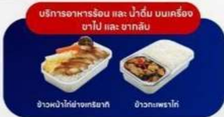
ข้าวพริกไก่ย่างเกาหลี