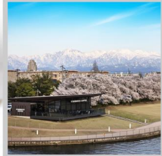
“TOYAMA KANSUI PARK”