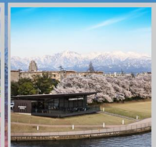
“TOYAMA KANSUI PARK”